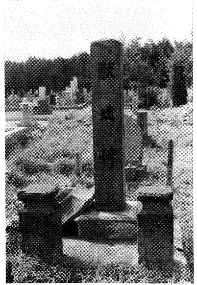
滝川斎苑の獸魂碑と馬頭観音

碑が多く見られたものであった。しかし、戦後になって自動車や農耕機械が多く使われてから馬を使うことが少なくなり、現在では主として競馬(挽馬競走用も含む)、食肉用としか飼育することはなくなっている。こうして、馬の飼育が少なくなり、また耕地整理がすすむにつれて、馬頭観音の姿も失われつつある。