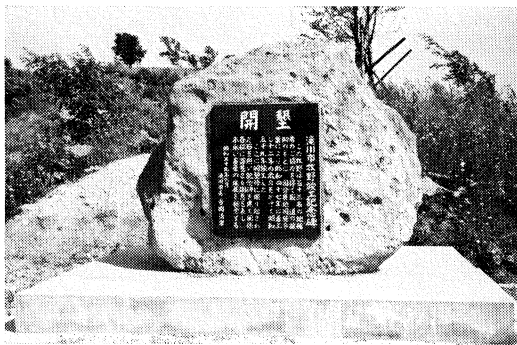
丸加山頂開墾記念碑

嗚呼世に美しく尊きものは人の和と協同の力である。洋々たる稲穂のうねり立ったこの地の歩んだ歴史を顧み、光賢同志労苦の跡を偲ぶとき感慨無量のものがございます。（中村正直）〇は判読不能