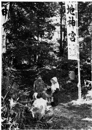
江部乙11の1 農事組合地神宮

このため、市内の農村地域には、近隣の人びとが協力し合って建てた地神宮や水神宮が数多く残されており、今もなお、これらの地