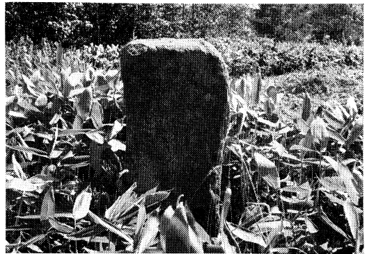
江部乙町阿部鼻地内の馬頭観音像

像は、等身大で木彫り、うるし塗りという立派なもので、頭部正面に馬頭観音の象徴である馬面が刻まれており、他の石造とは異なっていた稀少価値のある像である。