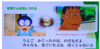
ドラえもん劇場 ～りんごをかじったのはだれ～