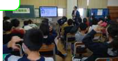
せきにんについて考える子どもたち