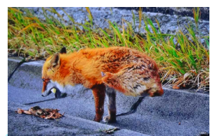
二本足のキツネ ～なぜ2本足になったのか～