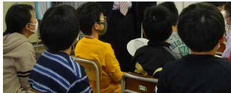
真剣に話を聞く子どもたち

今日は、人権について色々とお話していただき、ありがとうございました。今日教えていただいたことは、生活の中に、ぜひ活かしていきたいと思っております。