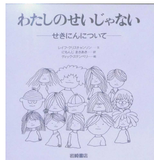
中心教材の絵本 レイフ・クリスチャンソン文