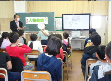
子どもによる絵本の朗読

今日は、人権について色々とお話していただき、ありがとうございました。今日教えていただいたことは、生活の中に、ぜひ活かしていきたいと思っております。