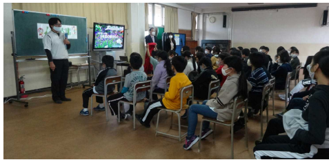
鏡先生による講師紹介