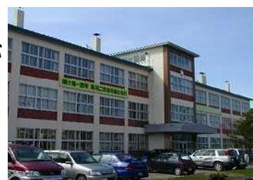
滝川市立滝川第一小学校