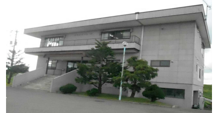
滝川振興公社(ゴルフ場)

カートに乗る練習をしたり、運転したり、元の位置にもどしたり、コースを一周したり、車の清掃をしたりと、どの体験もとても楽しかったです。