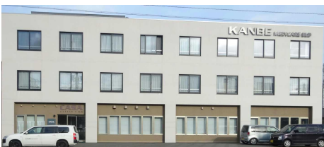
クリニカ カーサシーザーズ3号館