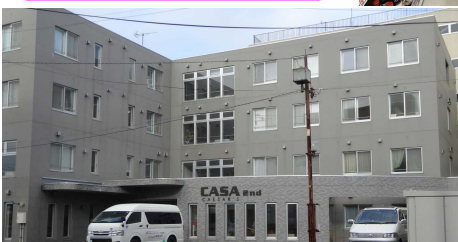
クリニカ カーサシーザーズ2号館

職員の皆さんが、お年寄りの方にいつも笑顔で対応していました。すばらしいと思いました。