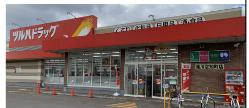
ツルハドラッグ空知町店

クリニカで働いている方は、とても大変だと思いました。しかし、お年寄りの方にしっかり対応していて、すごいと思いました。