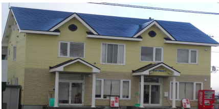
ヘアスタジオ ピュアHeart

西小学校では、子どもたちの交流がとても楽しかったです。他に、用務員さんの仕事も体験できたので、とてもよい経験になりました。