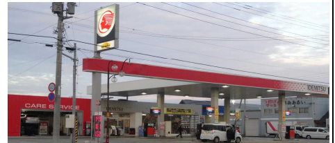
滝川西町SS 第一興産

石田クリニックでは、めったにできないことを経験させていただき、とても楽しいです。とにかく、体験する全てが新鮮でドキドキし、とても緊張しています。機械を慎重に扱ったり、患者さんに対応したりと、看護師の仕事は、とても重みがありました。