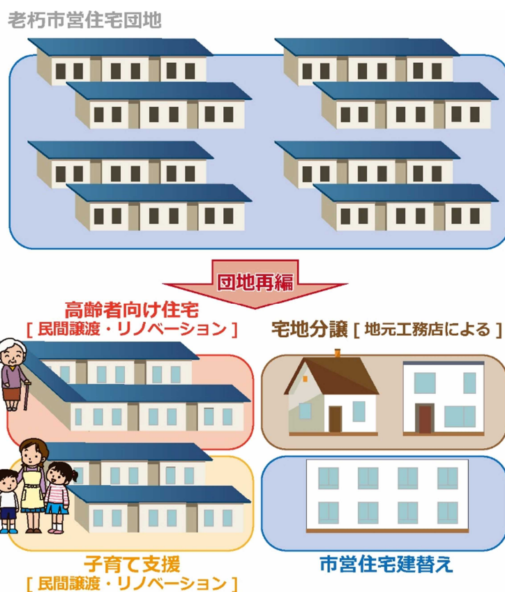
図 5-1 重点施策の展開イメージ