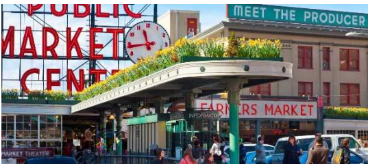
Pike Place Market