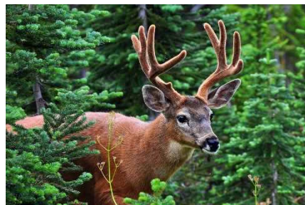
アメリカアカシカ