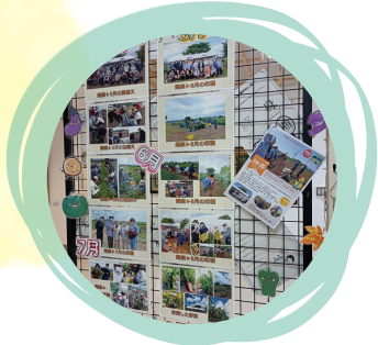
認知症事業パネル展