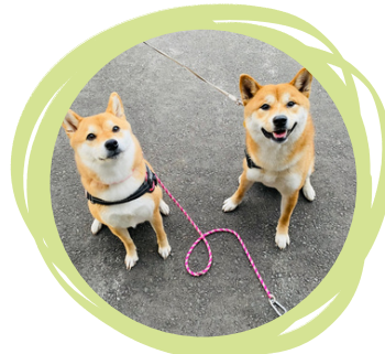
わんわんパトロール受付