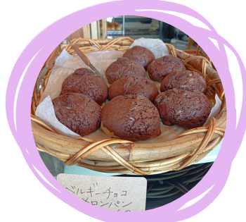
パン販売 無くなり次第、終了