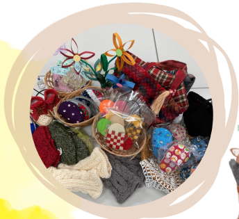
手作りマーケット