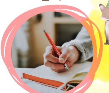
脳トレ講座「ペン習字」 13時~15時 定員10名 ※8月8日(火) 予約開始 参加費：150円