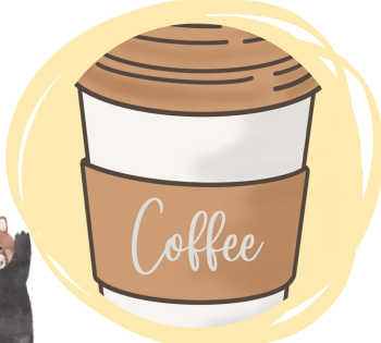
カフェ(飲み物・お菓子)