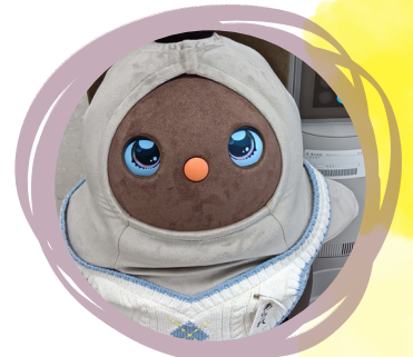
介護に寄り添うロボット コーナー