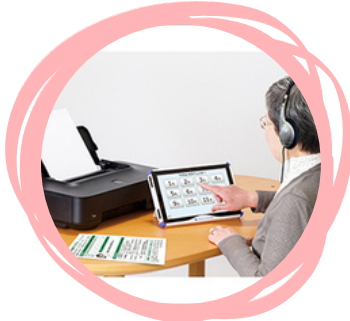
もの忘れ相談プログラム