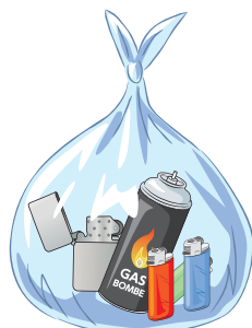
③ ライター、 ガス缶、 スプレー缶