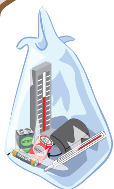
① 電池類、 水銀体温計、 水銀血圧計