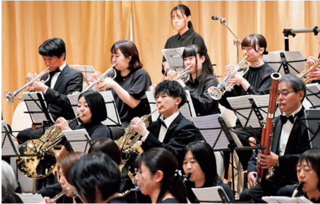
▲ブラスオーケスターによる迫力のある演奏が響き渡り、たくさんの来場者に感動を与えた『「風がみつけた街」たきかわ音楽祭』(4月19日/ホテル三浦華園)

人口：35,511人(158人) 男：16,829人 女：18,682人 世帯数：20,486世帯(令和8年4月30日現在)