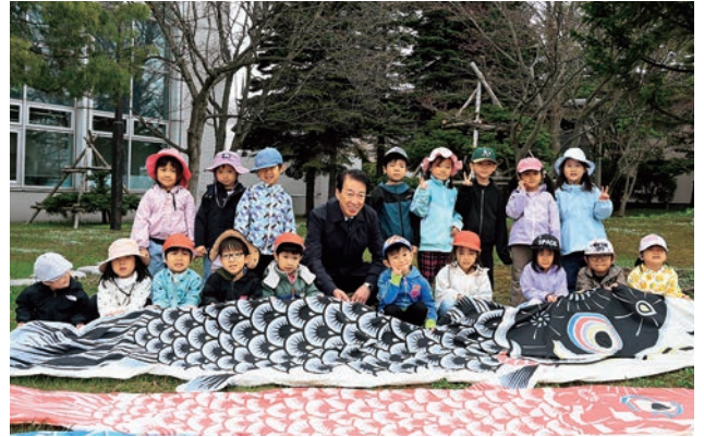
▲子どもたちが鯉のように力強く健やかに成長するよう願いを込め、滝川中央保育所の皆さんと市長と一緒に鯉のぼりを掲揚しました(4月28日/市役所)