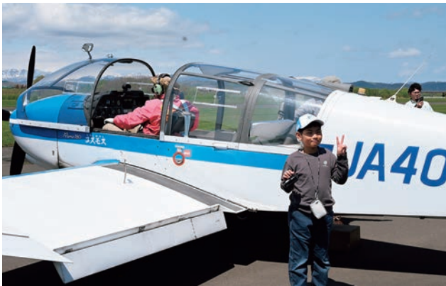
▲『子どもたちに大空のプレゼント』では、子どもたちが軽飛行機に搭乗し、景色を眺めながら大空の時間を楽しみました(5月5日/たきかわスカイパーク)