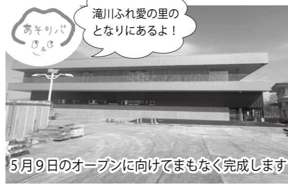
5月9日のオープンに向けてまもなく完成します

新たに科学館としての機能を備える「B & G あそりバ」も子どもたちが触れて、考えて、挑戦できる学びの場です。技術は進歩し、施設も新しくなりますが、子ども科学館が担ってきた役割は「B & G あそりバ」へと引き継がれていきます。