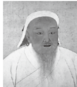
モンゴル国建国者 チンギス・ハーン