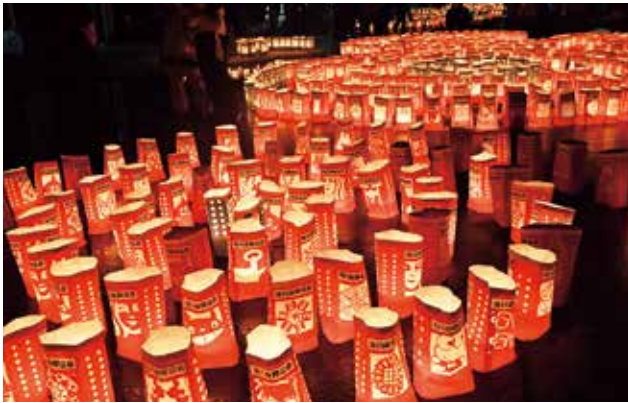
▲『第24回たきかわ紙袋ランタンフェスティバル』が開催され、滝川駅前通りを中心にベルロード周辺を多くのランタンの美しい光が彩りました(2月21日)