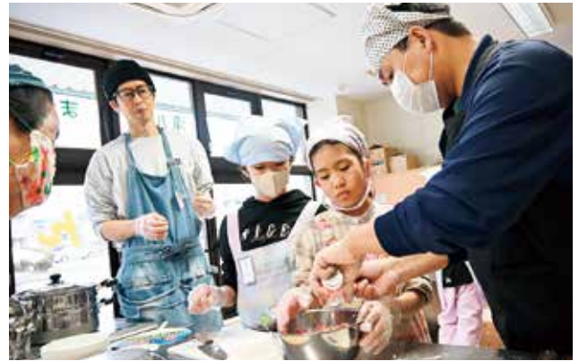
▲『モンゴルの正月料理「ボーズ」づくり体験』では、国際交流員と一緒に生地からこねてボーズを作り、みんなで食べました(2月28日/まちづくりセンター)