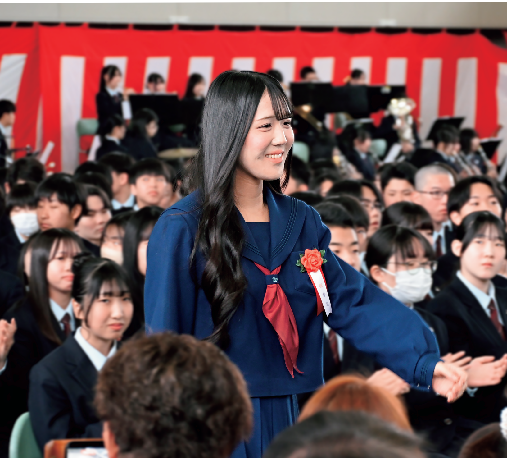
晴れやかな笑顔で迎える『卒業式』(3月1日／滝川西高等学校)