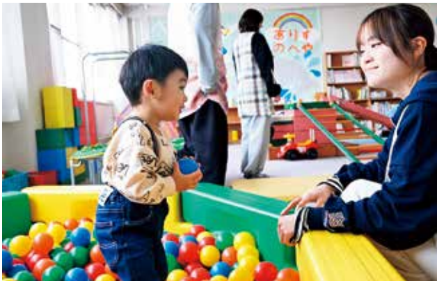
▲『子育てサロン「ありす」』では、子どもたちと一緒に学生がおもちゃで遊んだり、手遊びをしたりして交流しました(3月13日/国学院大学北海道短期大学部)