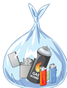
③ ライター、 ガス缶、 スプレー缶