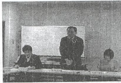
(明苑中学校区の様子)