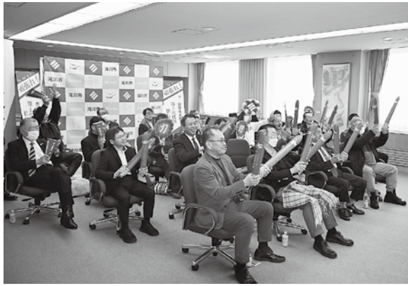
箱根駅伝の市役所パブリックビューイング 1月3日/市役所

市民の皆さまにおかれましては、新年の始まりをいかにお過ごしでしたでしょうか。私の三が日は例年のごとくでありました。 まず1月1日午前0時に滝川神社の元日祭に参列し、本年一年の滝川市と市民の皆さまの安寧を願いました。2日と3日は国学院大学陸上競技部駅伝チームが出場している箱根駅伝の応援をし、総合2位という結果に大興奮でした。ぜひとも来年は総合優勝をと夢を膨らませております。また、年賀状の整理をしました。いろいろな「しまい」が流行しているせいか届いた年賀状の量の激減に戸惑いました。私は市外にのみ年賀状を出しておりますが、一年に一度の同級生との安否確認もメールの時代となってきました。 私は今年の年賀状に「人間万事塞翁が馬」と書かせていただきました。これは、中国の北方の塞に住む老人(翁)の馬が逃げてしまったが、別の馬を連れて戻ってきたという話に始まります。そしてその馬に乗った息子が落馬してけがをしてしまいますが、そのおかげで戦に行かなくて済んだという話です。人生は良いことも悪いことも予測できない、何が良くて何が悪いのかは後になって分かるものなので、一喜一憂しないで物事にあたれという意味であると私は理解しています。 今の滝川市には多くの課題があり、そして時代の激しい波が押し寄せてきています。その中ではうれしい出来事もあり、つらい出来事もあります。そうした事象に一喜一憂することなく、どつしりと構えて泰然自若の精神でその本質を見据え、市民の皆さまの満足度を高めるまじくりに臨む所存であります。どうかご理解とご協力をよろしくお願いいたします。