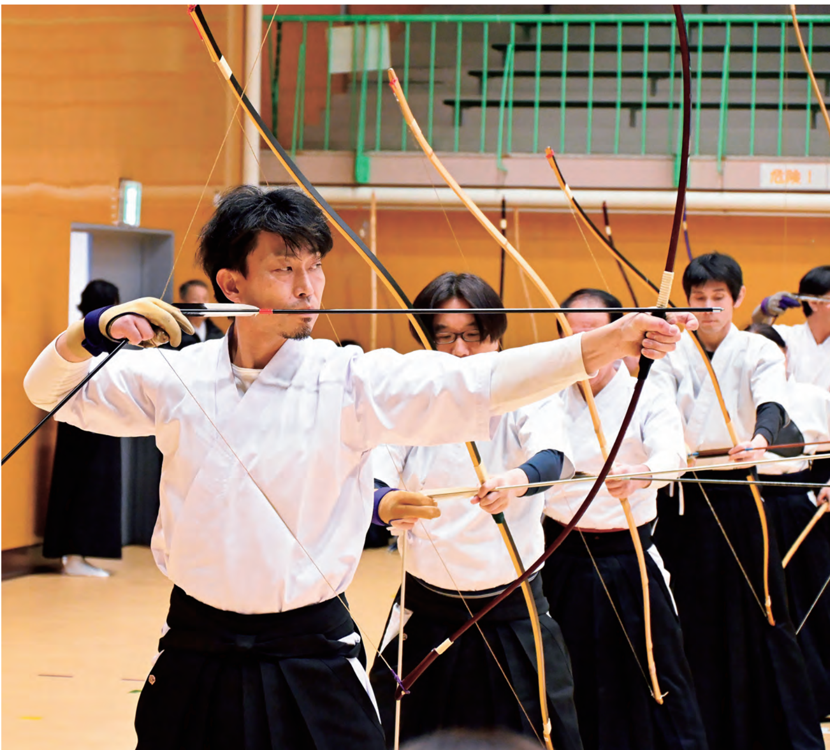
静寂の中、弓を引き的を射る「新春滝川市長杯弓道大会」(1月11日／滝川市スポーツセンター)