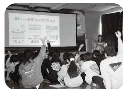
滝川第二小学校でのスマホ教室の様子

子どもたちはどれくらいネットに接しているのでしょうか。令和7年、市内の小学3年生から中学生までを対象に行った「インターネット利用に関する意識調査」では、回答のあった小学生では50%以上、中学生で70%以上がスマートフォンを所持していることが分かりました。幼いころから身近にネットがあるなか、正しくネットを活用するためにも正しい知識を身につける必要があります。滝川市では、市内の小学校で市教育委員会の職員を講師にスマホ教室を、中学校では、市と連携協定を結んでいる企業が情報モラル教室を行っています。