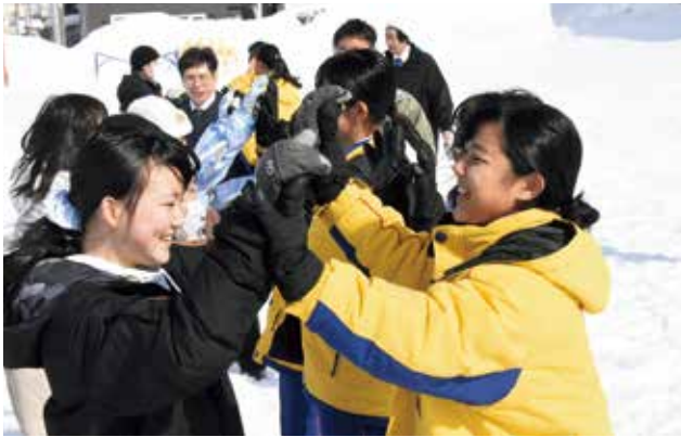
▲友好親善都市である沖縄県名護市から児童が来滝。スキーや雪遊びなどを通じて、親睦を深めました。『滝川名護児童交歓事業』（2月19日／滝川第一小学校）