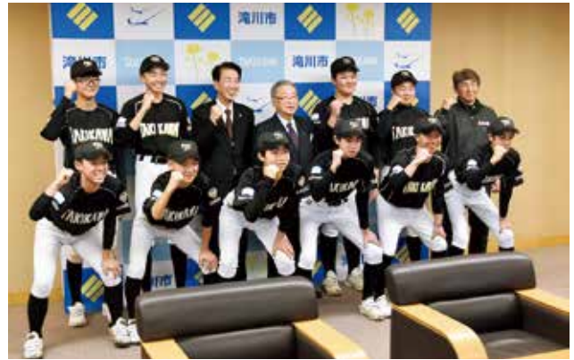
▲空知滝川リトルシニアが全国大会へ出場するため、市長を表敬訪問。大会に向けての意気込みを語り、最後はガッツポーズで記念撮影！（2月19日／市役所）