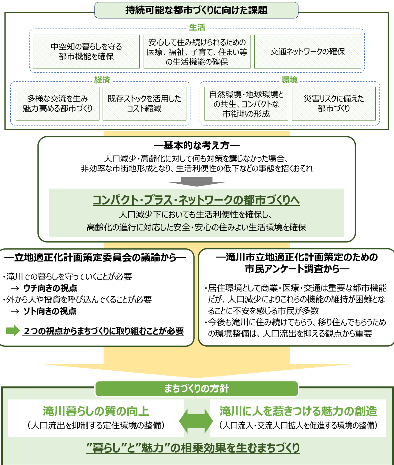
図 まちづくり方針の設定