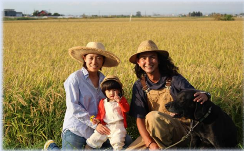
総合戦略の「基本目標1」に該当

おいしいお米、野菜は農家の皆様がいるからこそ——。 豊かな自然環境に恵まれた滝川市は、北海道の中央部に位置する道内有数の米どころ。将来の農業を担う後継者を対象とした滝川農業塾による研修やスマート農業を推進し、北海道農業を守ります。