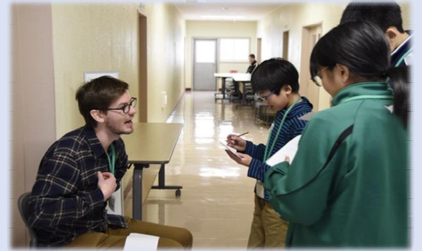
総合戦略の「基本目標2」に該当

日本の未来を担う人材を育む——。 滝川市では、地域の力を結集し、小学生から大学生まで、各年代に適した特色あるキャリア教育やグローバル教育に取り組んでいます。夢に向かって挑戦する主体性と行動力を身に付け、地元で、日本で、世界で活躍できる人材を滝川市から。