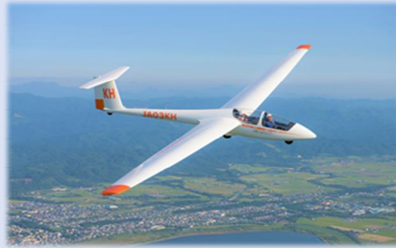
総合戦略の「基本目標1・3」に該当

大空へ舞い上がる風、澄み渡った空、広大な土地——。 滝川市は、グライダー飛行最高峰の環境を誇る地域。滝川子どもたちには、空からふるさとを眺める体験機会を提供し、大空への夢を育てています。また、グライダー体験とテレワークをセットにした「スカイワーケーション」で非日常を楽しむことも。